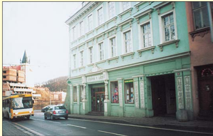
Současný snímek zachytil památný dům s historickou lékárnou. Ten je také poslední, který zůstal z celé Mlýnské ulice zachován. Lékárna v č.p. 6 vznikla roku 1848 a zůstala zde i po přestavbě domu roku 1872. Koncem 20. století prošel dům rekonstrukcí a obnovená lékárna nazvaná „Lékárna u lázní“ slouží veřejnosti dodnes.

zástavbu, došlo během sedmdesátých a osmdesátých let k její úplné likvidaci. V tomto údolí mezi Letnou a svahem směrem k Havlíčkovým sadům měl vzniknout nový lázeňský komplex, který se sice začal stavět, avšak nikdy nebyl