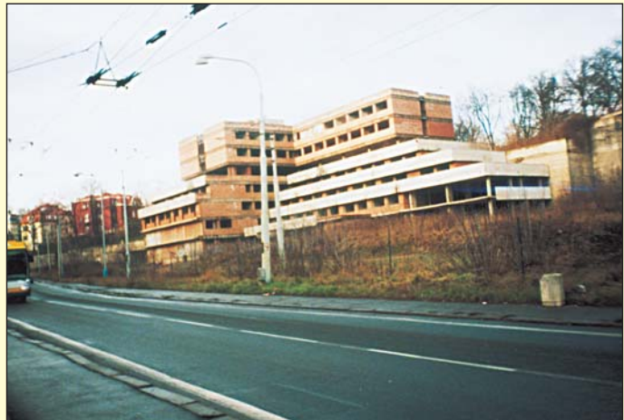
Mezi Mlýnskou ulicí a svahem směrem k Havlíčkovým sadům začal vznikat v osmdesátých letech 20. století lázeňský komplex, který nebyl nikdy dokončen. Tato pustina s celou ulicí je příkladem absurdismu nejen ve vzhledu a charakteru jinak nejstarších českých lázní.

Mlýnská ulice vznikala postupně už od dvacátých let 19. století a vytvořila spojnici mezi lázeňskými Teplicemi a lázeňským Šanovem. Své pojmenování obdržela podle tří mlýnů, stávajících tehdy na břehu Kočičího potoka. Vedla od někdejšího tzv. horního mlýna v prostorách dnešních Císařských