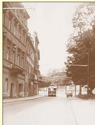
Mlýnská ulice roku 1985 před úplným zbouráním starých domů. V jejich přízemní části jsou patrné prostory dřívějších obchodů, krámků, hospod a dalších služeb.