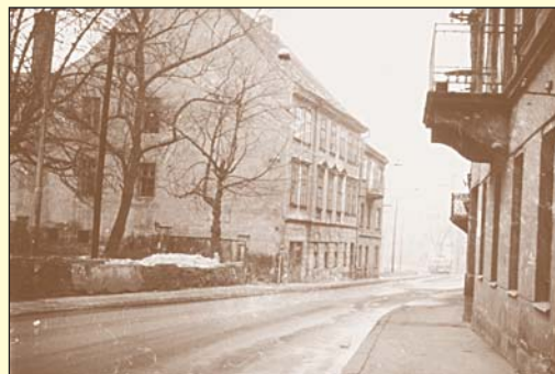
Mlýnská ulice roku 1984 v místech, kde se též nacházela zahrada s vysokými stromy. Po zbourání domů došlo též k jejich zcela zbytečnému pokácení, obdobně jako se to děje dnes po celém městě.