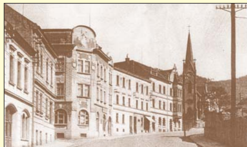
Na snímku z roku 1910 spatříme Schichtovu, později Žukovovu ulici, s evangelickým kostelem na Střekově.