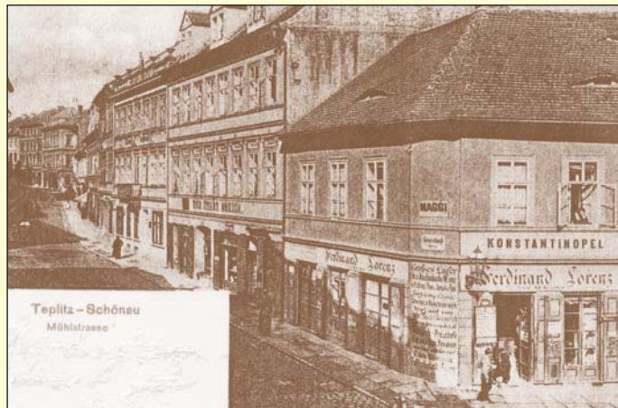
Pohlednice na zakřivenou frontu domů v Mlýnské ulici od její spodní části směrem do centra Teplic pochází z konce 19. století.

Do celé této čtvrti, která obzvláště po druhé světové válce stále více chátrala, nechtěl nikdo nic moc investovat, a tak docházelo postupně k jejímu chátrání a odbourávání. Vzhledem k nové koncepci, která zcela vymazala starou