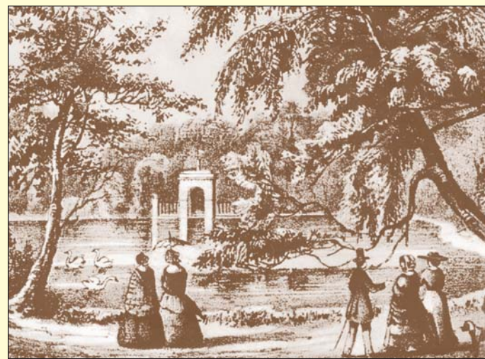
Dobová kresba Zámecké zahrady z první poloviny 19. století.