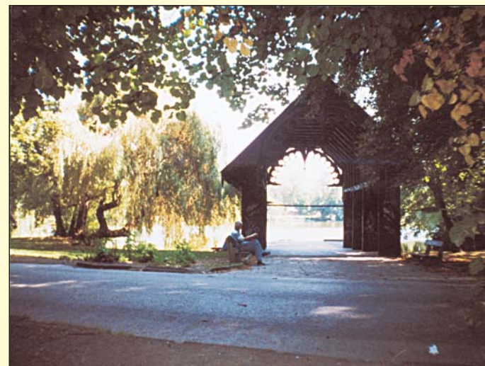
Jedna z promenádních cest v Zámecké zahradě vede kolem dřevěného přístavku s vyřezávanými obrubami štítů, kde dříve stávaly gondoly pro panstvo. V pozdější době sloužil jako úschovna loděk. Cesty a zákoutí v Zámecké zahradě zvou k procházkám a odpočinku i dnes.

V pozdější době, kdy tu došlo k postavení klecí a výběhů pro zvířata i vzácné ptactvo, sem zase přicházelo množství dětí s rodiči. V největším z výběhů se nacházeli medvídci mývalové, ale ti obvykle celý den většinou jen prospali, což nebylo pro návštěvníky tou pravou atrakcí. Proto medvídky časem nahradily temperamenní, hbité a zábavné opice. Podle toho se tomuto místu také začalo říkat "u opiček". Tato před časem obnovená část Zámecké