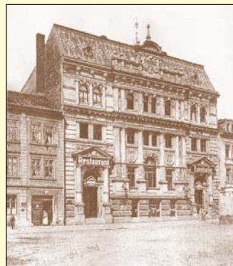
Zcela první filmové představení shlédli Ústečané právě v sále této Turnhaly. Dnes se jedná o zadní sál restaurace Budvarka ve Vaničkově ulici, hned za divadlem. Snímek byl pořízen roku 1896, rok před prvním promítáním.