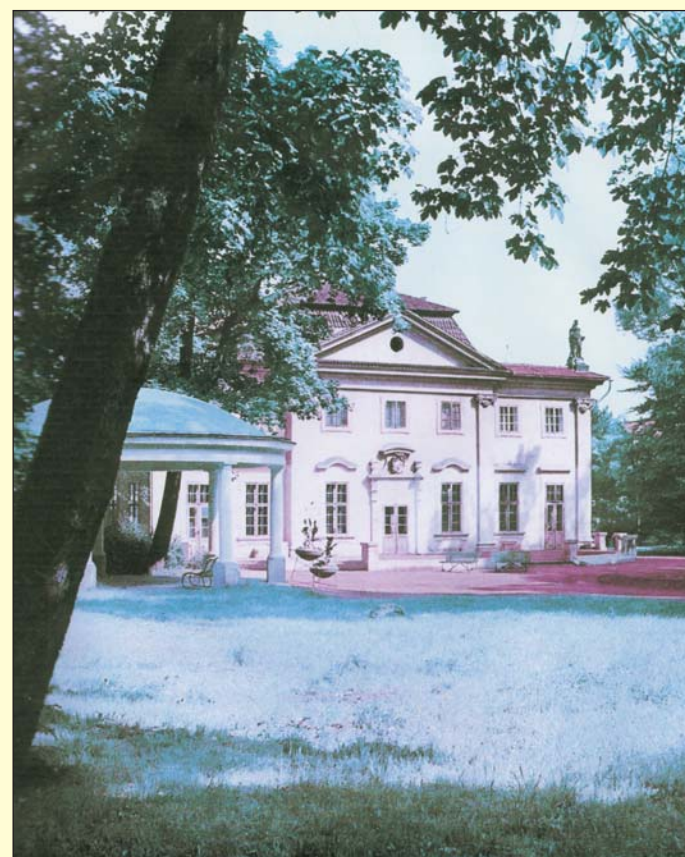
Zahradní a plesový dům s pavilónkem patřil v dávných časech k nejnavštěvovaným místům Zámecké zahrady. Dnes zde najdete Casino a restauraci.