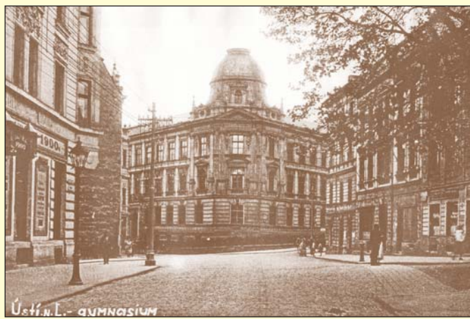
V sezóně 1908 až 1909 promítal kočovný kinematograf bratří Oeserů v sále „HOTELU 1900“, který stával na rohu Pivovarské a velké Hradební ulice. Na snímku z roku 1920 jej spatříme zcela vlevo. Dům, ve kterém se hotel nacházel, už dávno nestojí.

O prvním ústeckém kinematografickém představení se kromě několika krátkých oznámení v denním tisku nedochovaly žádné prameny. Z novinových notic vyplývá, že představení se uskutečnilo v Kneipově sále ústecké Turnhale,