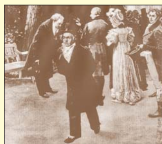
Na promenádách v Zámeckém parku bylo možné potkat celou řadu významných osobností. V roce 1812 zde např. došlo k proslulému setkání dvou uměleckých velikánů - Ludwiga van Beethovena a J. W. Goetha s rakouskou císařskou rodinou.

bě koncertů setkávali známí, navazovala se nová přátelství a vlastně tady probíhala i módní přehlídka téměř celé Evropy. Restaurace i dvůr, ležící na jihovýchodním konci zahrady, se pak staraly o občerstvení a veškeré potřeby návštěvníků.