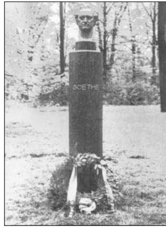
Pomník J. W. Goetha.

Roku 1894 došlo ke vztýčení pomníku padlých vojáků tehdejších okresů Teplice, Bílina, Duchcov a Chabařovice ve válkách od roku 1848 do roku 1866. Pomník z hořického pískovce měl přes 11 metrů. Na podstavci se tyčil obelisk ukončený dvojhlavým orlem. Jinak zde bylo možné spatřit postavy vojáků, děla a různé emblémy. Pomník přežil pád monarchie, první republiku i světové války. Zlikvidován byl teprve až roku 1948