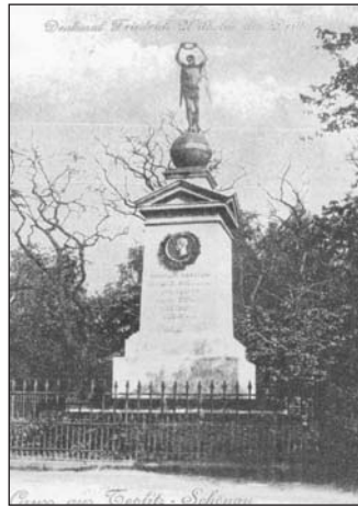
Pomník pruského krále Bedřicha Viléma III. z roku 1841.

za pomoci tanku. Na jeho místě dnes u Kamenných lázní v šanovském parku najdete kruhový květinový záhon.