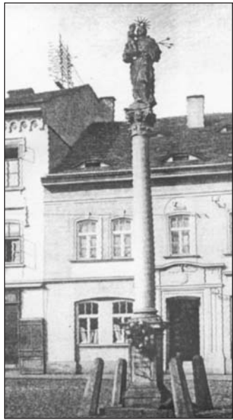
Sloup na Mírovém náměstí.

Cíнем purkmistra J. W. Kleinnickela se pak zase stala přeměna původně dřevěného mostu přes Bílinu na most kamenný v letech