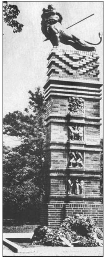
Pomník padlým v první světové válce z roku 1930.