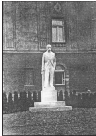
Pomník T. G. Masaryka.

Neoblíbenou osobností pro církev a vrchnost, ale o to oblíbenější pro lidové vrstvy, se stal císař Josef II. díky svým tolerančním patentům, zrušením nevolnictví a pochopením pro nižší sociální vrstvy. Po sto letech však byla značně dezinterpretována jeho snaha prosadit německý jazyk, takže byla chápána jako symbol němečtí. Převážně německé Ústí nad Labem proto usilovalo také o vlastní pomník věnovaný císaři Josefu II. Ten byl také postaven a slavnostně odhalen v roce 1885, což nebylo dobře hodnoceno zejména Čechy. Po pádu monarchie byla také tato socha odstraněna a na tomto místě se ocitla později jiná, ztěles-