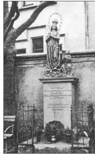
Socha Panny Marie.