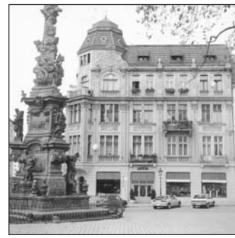
Sloup N. Trojice z roku 1718.

V Zámecké zahradě stával též pomník německého básníka J. W. Goetha, kterého Teplice velmi okouzlovaly a kam se rád vracel. V místě, kde se též procházel s Ludwigem van Beethovenem a předčítal své verše císařovně Marii Ludovice, stál jeho pomník od roku 1932. Jeho tvůrcem se