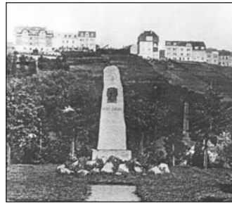
Snímek obelisku zakladatele německého tělovýchovného hnutí Ludwiga Jahna

Nepřehlédnutelný obelisk s plaketou zakladatele německého tělovýchovného hnutí Ludwiga Jahna vznikl poblíž někdejší sladovny v Městském sadu ještě za dob Rakousko-Uherska. I tento pomník však byl později trnem v oku zdejších Čechů, neboť historie a smutné zkušenosti zprofanovaly téměř vše, co bylo německé.