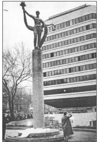
Pomník před hotelem Vladimír.

Po druhé světové válce nastala doba likvidace německých pomníků a soch a zároveň započalo období budování pomníků v duchu komunistické ideologie. V roce 1971 došlo třeba k odhalení pomníku Klementa Gottwalda, který