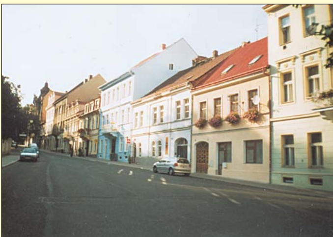
Dnešní Lipová ulice v pohledu směrem od Šanova. V jednom z těchto domů pojmenovaném „Francouzský dvůr“ pobýval u své babičky též známý a slavný rakouský komik Max Böhm.

Lázeňský Šanov zůstával dlouho samostatnou obcí, třebaže se nacházel v těsném sousedství pod Teplicemi. Šanov s Teplicemi spojovala dávná cesta, která vedla podél bývalého městského hřbitova, který byl v roce 1964 zrušen a na jeho místě vznikl park. Po