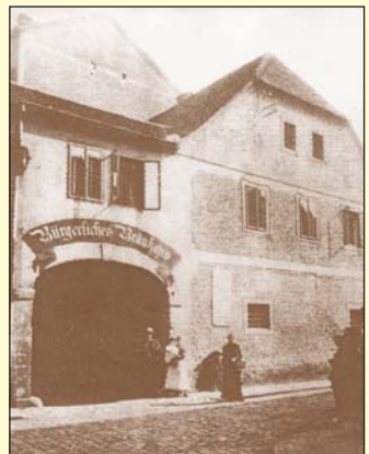
Měšťanský pivovar na rohu Dlouhé a Pivovarské ulice byl zachycen nedlouho před jeho zbořením v roce 1894.