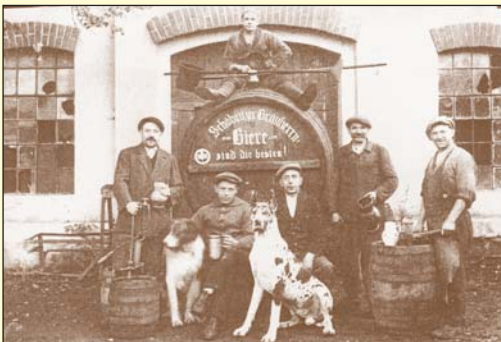
Záběr ze třicátých let 20. století zachytil osazenstvo pivovaru ve Všebořicích.