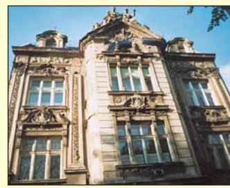
Mnohé z domů v Lipové ulici patří k pozoruhodným stavbám. Naleznete zde jak budovy z klasicistní výstavby města, tak i stavby s aplikací historických slohů.

stupně domovní zástavba v místech, kde se předtím rozprostírala jenom pole a vinice. Kontakt architektury spolu s přírodní složkou tak vytvořily přívětivý charakter této ulice. Dnes zde naleznete jak domy z klasicistní výstavby města, tak i stavby s aplikací historických slohů. Ve všech domech v ulici se tradičně pronajímaly pokoje lázeňským hostům. Narazit se tady ovšem dalo i na řadu vybraných restaurací, kaváren, vináren, na lázeňské a vojenské hospitály. Rozložitý dům při úpatí výšiny Mont de Ligne nazvaný Routový