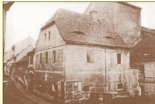
Počátky starého měšťanského pivovaru v Ústí n. L. sahají až do 16. století. Jeho snímek byl pořízen počátkem devadesátých let 19. století.

K nejstarším podnikům potravinářského odvětví u nás patří pivovary. V dávných časech náležely mezi ně jednak vrchnostenské pivovary provozované na jednotlivých panstvích a dále pivovary měšťanské, které patřily společností pravovárečnických měšťanů. Na území dnešního Ústí nad Labem se jednalo o oba typy pivovarů.