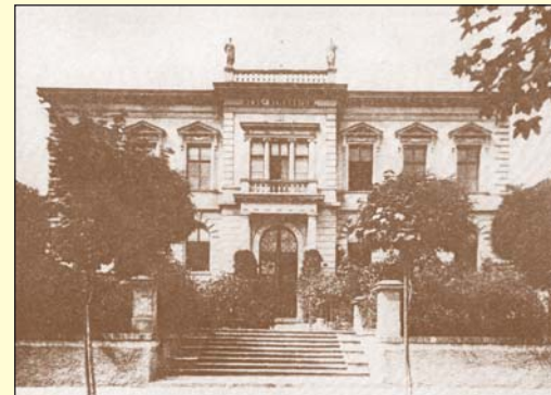
Budova původního teplického reálného gymnázia v Lipové ulici koncem 19. století, kde se vyučovalo od roku 1875 do roku 1894. Dnes se jedná o sídlo Regionální knihovny.

věnc, měl své místo též v historii teplického divadelnictví. V zahradě tohoto domu totiž sloužilo letní divadlo od roku 1865 až do otevření samostatného městského divadla v roce 1874. Zatímco večer se hrávalo v někdejší záměckém divadle, odpolední představení se konala právě v Routově věnci.