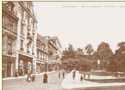
Lipová ulice vznikla z cesty vedoucí od Teplic do Šanova. Snímek z roku 1907 zachycuje její začátek směrem od Teplic, kam se odbočovalo z bývalé Císařské třídy, dnešní ulice U Císařských lázní. Vpravo při ulici se kdysi nacházel městský hřbitov. Dnes je zde park s bustou básníka J. G. Seumeho.