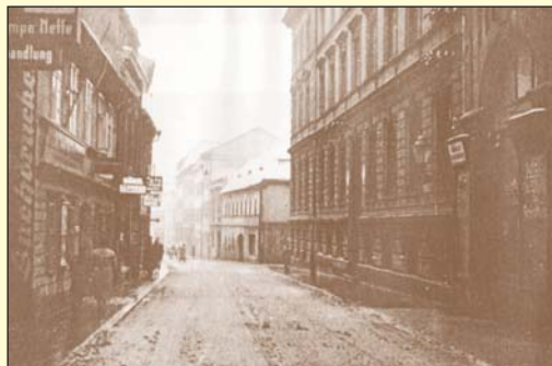
Pohled do Dlouhé ulice kolem roku 1930 od západu ve směru k Mariánské skále. V popředí vlevo částečně spatříme bývalé železářství Lumpe.

Dlouhá ulice patřila v Ústí nad Labem k velmi starým komunikacím města. Začínala v místech u někdejší Horní, nebo-li Drážďanské brány, vedle níž stával původně jednopatrový hostinec z roku 1798, který později ustoupil budově, v níž se nacházela kavárna Savoy. Dnes dům slouží bankovním účelům. V těchto místech Dlouhá ulice navazovala na