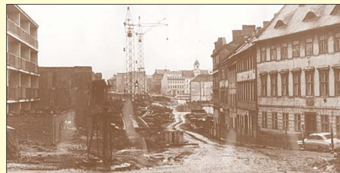
Pohled do Zelené ulice v Teplicích při její likvidaci a zároveň nové výstavbě v roce 1974. I zde se v původní zástavbě nacházela celá řada domů nejrozličnějších poetických názvů. Např. ten zcela vpravo na snímku - devitisový, dvouposchodový, nesl název Tři duby.