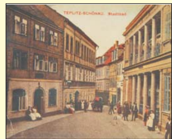
Před sto lety - v roce 1906, kdy byl snímek pořízen, se v ještě ucelené Lázeňské ulici soustřeďovala řada hotelů nejrozličnějších názvů. Naproti lázním Pravidla z nich dodnes zůstaly lázeňské domy Zlatá studna, Zelený kříž, Zlatý pelikán, Zlatá harfa a Zlatá studna.

Původní město tvořila v podstatě jeho dnešní vnitřní část, ohraničená Zelenou ulicí, Zámeckým náměstím, Lázeňskou a Krupskou ulicí i Tržním náměstím, dnešním náměstím Svobody. Několik dalších ulic uvnitř pak tvořilo hlavní tepny městského života. Z celkového počtu 266 domů v roce 1816 nebylo pronajímáno pouze 26 malých domků, z dalších objektů jen Pravidlo, tehdy ještě bez ubytovací části, kostel, radnice a střešnice. Veškeré ostatní domy poskytovaly přes tisíc pokojů a 415