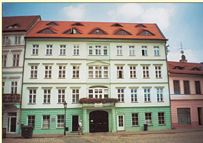
Dům Zlatý kříž na Zámeckém náměstí pochází z roku 1809. V roce 1813 v něm tři monarchové formulovali dohody o koordinaci vojenských akcí proti Napoleonovi i závazky o novém uspořádání Evropy po napoleonských válkách.

Po velkém požáru starých, převážně dřevěných Teplic v roce 1793, začaly vznikat nové domy a hotely do osobitě podoby empírového lázeňského města, jež se stávalo salónelem Evropy. Tehdejší obchodně založení majitelé vytyčili dobrou možnost výdělků, a tak vymysleli svéráznou reklamu v podobě pojmenování jednotlivých domů. Je třeba připomenout, že ti, kteří všechny nejrozličnější názvy vymýšleli, projevíli zároveň citlivý vztah i ke zvláštnostem lázeňského prostředí.