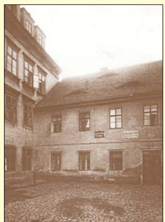
Fotografie z konce 19. století stačila ještě zachytit domy v Dlouhé ulici čp. 328 a 708, k jejichž zboření došlo v roce 1901.