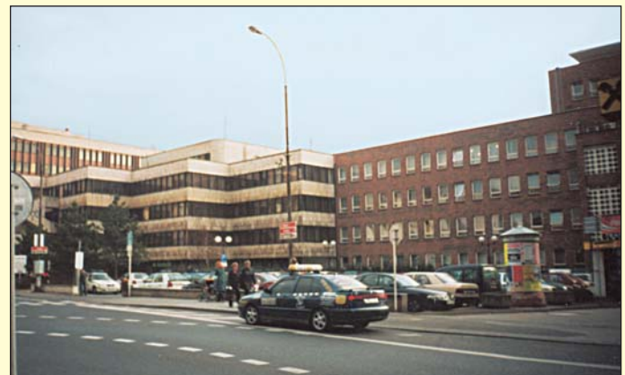
Dlouhá ulice v současnosti. Po staré zástavbě na jižní straně už nezbyly žádné památky.