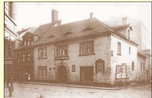
Na rohu Dlouhé a Mlýnské ulice se v domě čp. 219 nalézal hostinec „U města Lipska“. Snímek pochází z roku 1925.

Dlouhá ulice patřila v Ústí nad Labem k velmi starým komunikacím města. Začínala v místech u někdejší Horní, nebo-li Drážďanské brány, vedle níž stával původně jednopatrový hostinec z roku 1798, který později ustoupil budově, v níž se nacházela kavárna Savoy. Dnes dům slouží bankovním účelům. V těchto místech Dlouhá ulice navazovala na