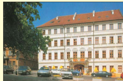
Na místě bývalých menších domů pojmenovaných U zlaté trojky a Tři bažanti vznikl roku 1824 třípatrový objekt proslulého hotelu Prince de Ligne. Po jeho kompletní rekonstrukci koncem 20. století tak opět reprezentuje lázeňské město. Na snímku zcela vlevo spatříme ještě část domu U tří sokolů z let 1810 až 1811.

komor pro služebnictvo. Úlohu garáží zastupovaly tehdy stáje ve dvorech, v nichž bylo možné ustájit až 475 koní.