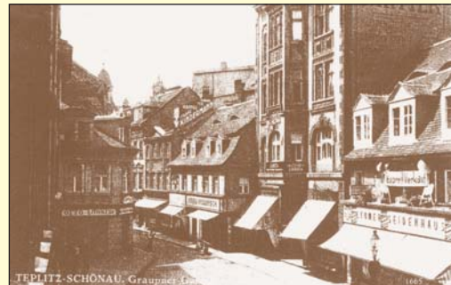
Krupská ulice se původně na jednom místě staré zástavby dost zužovala. Snímek kolem roku 1935.