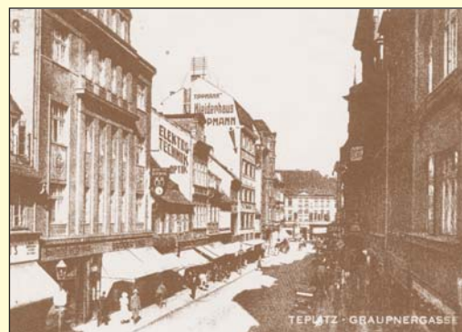
Krupská ulice počátkem 30. let 20. století s typickými stříškami rolet na vchody do obchodů a restaurací.

klasicistní domy. A třebaže se nová architektura nemusela každému zamlouvat, nejméně pak památkářům, otevření prvního obchodního domu před 75 lety tohoto typu v lázeňském městě vyvolalo značný zájem mezi kupujícími i všemi dalšími, kteří si přicházeli prohlédnout nedělené haly rozprostírající se přes celá patra a množství zboží vystavené ve zdejších interiérech. Název obchodního domu Jepa se pak dobře vžil do paměti Tepličanů a přezíval často ještě i dlouho po druhé světové válce, kdy obchodní dům, tentokrát už pod názvem Krušno-