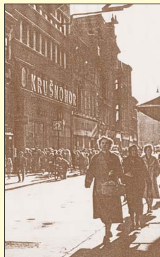
Živý ruch Krupské ulice v padesátých letech 20. století u Krušnohorského prvního obchodního domu Teplic, který se zcela původně nazýval Jepa.

hor, sloužil kupujícím až do sedmdesátých let 20. století, kdy jej nahradil nový obchodní dům na dnešním náměstí Svobody. Obchodní dům v Krupské ulici přinesl Tepličanům moderní způsob prodeje v účelně a racionálně řešené budově, která předznamenala, kudy se asi bude ubírat nová