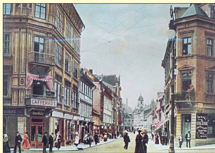
Krupská ulice na přelomu 19. a 20. století směrem od divadla v místech, kde do roku 1823 stála Krupská brána. V rohovém domě vlevo vévodila tehdy vyhlášená kavárna Na vyhlídce.