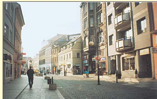
Krupská ulice dnešních dnů.

S Krupskou ulicí je též spojena existence prvního obchodního domu v Teplicích s mnoha druhy zboží pod jednou střechou. Vznikl roku 1932 na místě někdejšího starého domu Terst. Tehdy se jednalo o moderní budovu, která poněkud nezapadala mezi staré