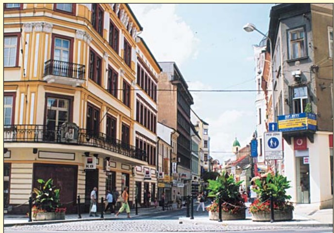
Současný pohled do Krupské ulice směrem od divadla. V místě někdejší kavárny Na vyhlídce zcela vlevo dnes najdete Komerční banku.

Od dob středověku až do konce 18. století patřila Krupská ulice k původnímu jádru města, které bylo obehnané městskými hradbami. Do Krupské ulice se vcházelo z bývalého Tržního, dnes náměstí Svobody a z ní se vycházelo ven mimo hradby malou městskou branou pojmenovanou stejně jako ulice podle cesty, která z Tržního náměstí vedla směrem na Trnovany a pokračovala