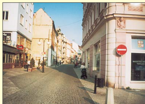
Pohled do současné Krupské ulice směrem od náměstí Svobody.