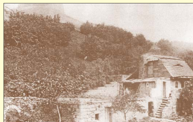
Starý mlýn v Sebusíně zachytil fotoaparát ještě na konci 19. století.