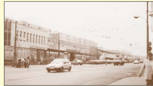
Fotografie z devadesátých let 20. století již zachycuje, že někdejší střed Trnovan, kde se větvily ulice směrem na Ústí nad Labem a Bohosudov, získal zcela jiný ráz.

se zvířaty. Netrvalo však dlouho a po venkovské architektuře nezůstalo ani památky.