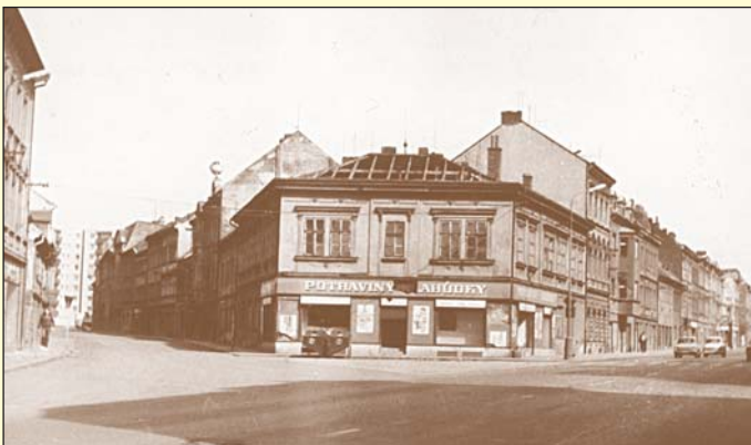
Střed starých Trnovan krátce před zbořením v roce 1985. V budově uprostřed, kde dříve sloužily restaurace Kotva a Diana, bývala ve druhé polovině 20. století potravinářská prodejna Lahudek.

Přerod Trnovan z vesnice na průmyslové město začal v sedmdesátých letech devatenáctého století, kdy zde docházelo k založení významných továren a závodů. Postupně tak mizela veškerá původní venkovská atmosféra zdejším zemědělců a Trnovany se začaly stále více podobat městské zástavbě. Svůj nemalý podíl na tomto rozvoji hrála i blízkost městských a lázeňských Teplic, které se navíc stále rozrůstaly a blížily směrem k Trnovanům.