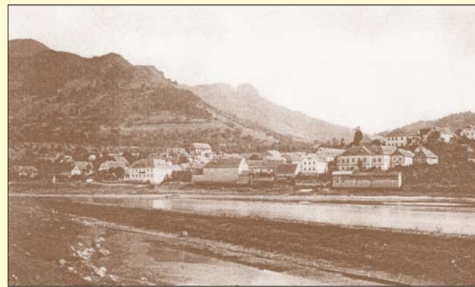
Pohled na Sebusín směrem od Zálezle byl pořízen kolem roku 1900.