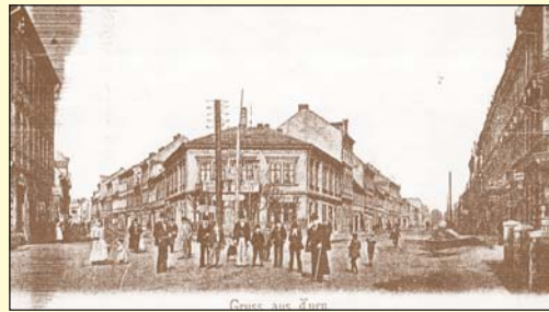
Střed starých Trnovan na přelomu 19. a 20. století v místech, kde se tzv. Hlavní třída větvila na Bohosudovskou a Chlumeckou ulici.

Ještě však na přelomu devatenáctého a dvacátého století se podařilo v Trnovanech na fotografických snímcích zachytit některá dřívější vesnická zákoutí, staré nízké domky, hospodářská stavení, obecní rybník i zemědělské potahy