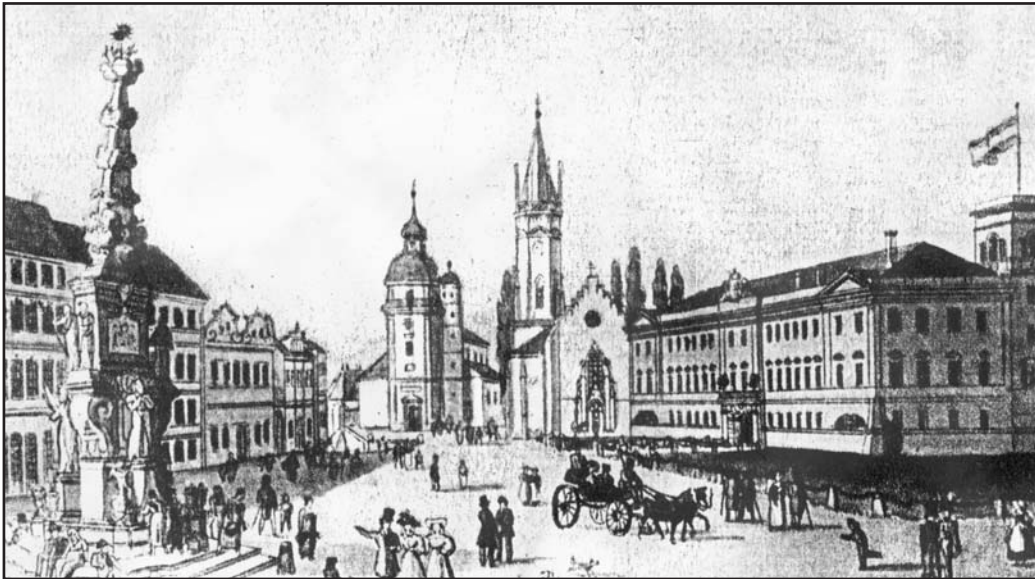
Zámecké náměstí tvořilo nejstarší jádro původních Teplíc. Do dnešních časů se také jeho půdorys i podoba téměř nezměnily. Dobová kresba zachycující zdejší čilý ruch pochází z první poloviny 19. století

Podle pověsti Václava Hájka z Libočan byly teplické termální léčivé prameny objeveny již za vojvody Nezamysla roku 762 prasátkou rytíře Kolostúje. V té době již tedy zřejmě patřily Teplice nebo alespoň jejich blízké okolí pod Krušnými horami k trvale osídleným. Avšak teprve až ve 12. století vnáší prudké světlo do temnoty, do níž je ponořeno zrození Teplíc a jejich lázní.