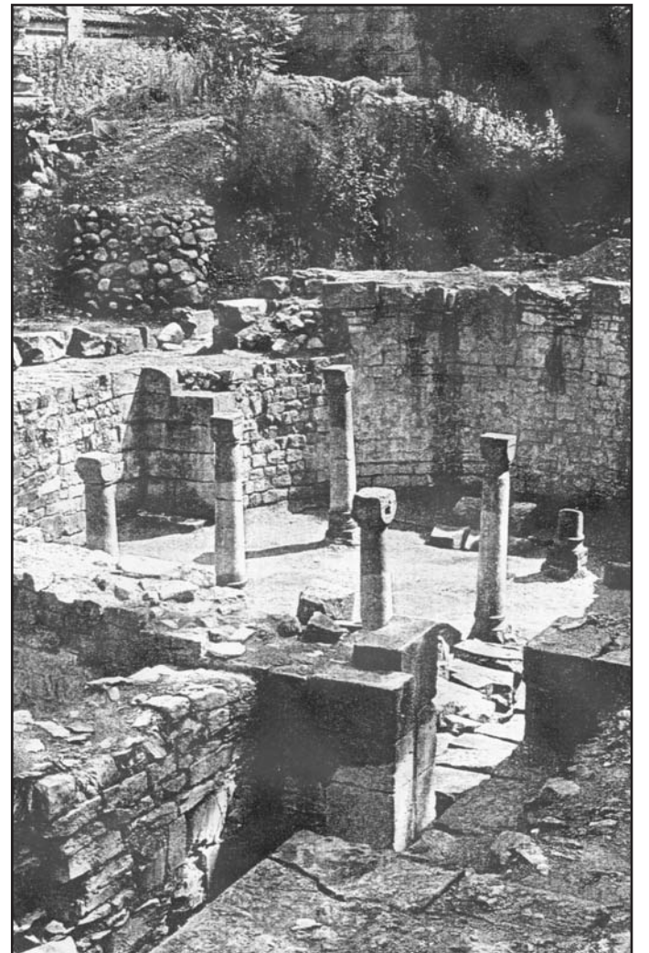
Vykopávky poblíž centra a dnešního Pravřídla u zámku odhalily původní románský sloh, a tak potvrdily začátek historie Teplíc ve 12. století.

V průběhu středověku se rovněž Teplice nechaly obehnat silnou zdí ochranných hradeb, které pak město svíraly až do konce 18. století. Původní staré jádro města, které vznikalo kolem kláštera a později kolem zámecké budovy a přilehlého náměstí, zasahovalo severním směrem Dlou-