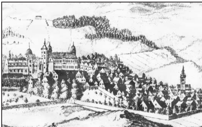
Celkový pohled od severu na původní jádro starých Teplíc obehnaných hradbami ještě i v 18. století. Vlevo spatříme děkanský kostel a zámeckou budovu, vpravo pak dominantní starou původní radnici uprostřed dnešního náměstí Svobody.

Vykopávky provedené po 800 letech odhalily, k jak odvažné a osobité stavební činnosti v Teplících došlo. V přís-