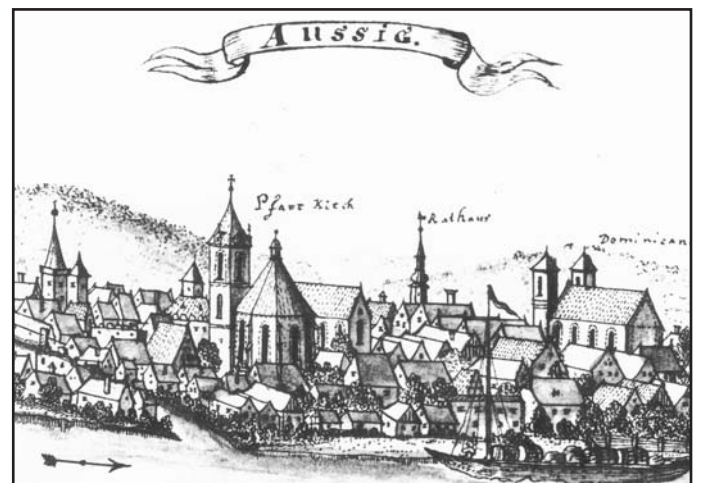
Pohled na město, stále ještě středověkého charakteru, kolem roku 1750 za vlády Marie Terezie směrem od řeky Labe.

13 hektarů. Středověký charakter Ústí nad Labem s hradbami pak až na některé dílčí změny vydržel prakticky do počátku 19. století.