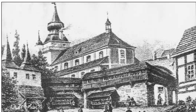
Dobová kresba z 18. století zachycuje Lázeňskou bránu pod Děkanským kostelem, která zde stála až do velkého požáru Teplic v roce 1793. Dále spatříme renesanční Kolostujovy věžičky, které již přestaly věky i část někdejší zástavby ještě před požárem.