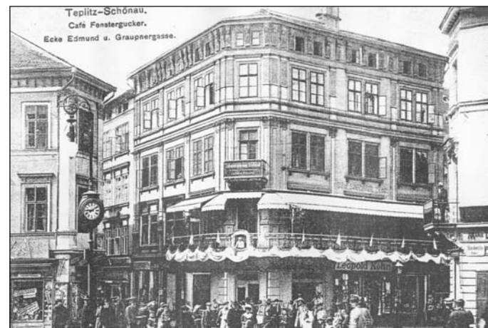
Snímek z roku 1909 zachycuje pohled do míst, kde až do roku 186 stávala Krupská brána. Tomuto místu se před rokem 1918, nazývaném Rudolfovo náměstí, obecně říkalo Točna, neboť sem ústilo několik ulic ze všech stran.