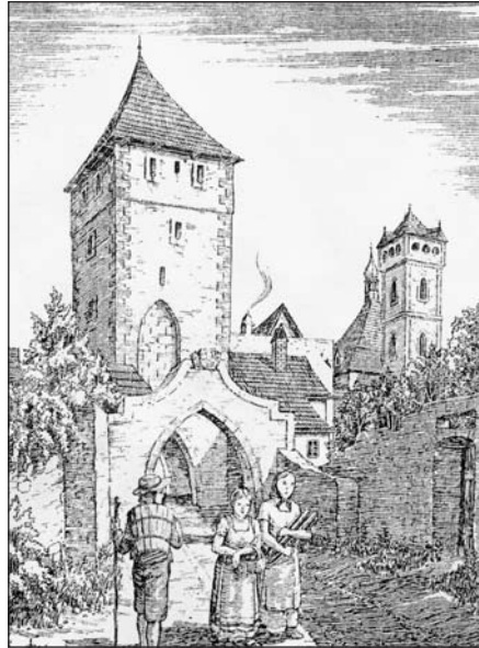
Teplická brána, jak vypadala po své rekonstrukci v roce 1580. Stávala v místech dnešní křižovatky Masarykova - Revoluční.

Další z bran vedoucích z města jižním směrem zvaná Bílinská, se též nazývala Pražská, neboť se z ní vyjíždělo jak směrem k řece Bílině, tak i na Prahu. Zbořena byla roku 1835. Severním směrem vzhůru se z Ústí vyjíždělo Horní bránu, která získala též označení Drážďanská, neboť tudy vedla cesta do sousedního Saska. Ta ustoupila, jako už dosti zchátralá, první ze všech, roku 1832. Vedle ní stával jednopatrový hostinec z roku 1798, který pak ustoupil pozdější budově, v níž se nacházela kavárna Savoy. Dnes zde slouží jeden z ban-