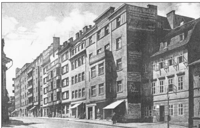
Snímek z roku 1934 přibližuje tehdejší Mysliveckou ulici, která se dnes jmenuje U Zámku. Právě v těchto místech bylo možné až do roku 1810 spatřit Zámeckou bránu, které se též říkalo Bílinská.

padního směru od Bíliny a Duchcova. Nacházela se v prostorách dnešní ulice U Zámku, v sousedství Zámecké zahrady. Byla zbourána roku 1810 jako druhá v pořadí. Jedna z menších bran uzavírala Krupskou ulici v místech dnešní křižovatky Krupská - U divadla - U Císařských lázní - Masarykova. Nazývala se Krupská nebo také Drážďanská. K její likvidaci se přistoupilo v roce 1826. Připomínkou na ni je ulička U Krupské brány, vedoucí na Benešovo náměstí. Čtvrtá masivní věžovitá brána, kde též sloužila šatlava a později i kovárna, byla situována do míst dnešního poštovního úřadu, kudy se přichází z náměstí Svobody k restauraci Slávie. Jmeno-