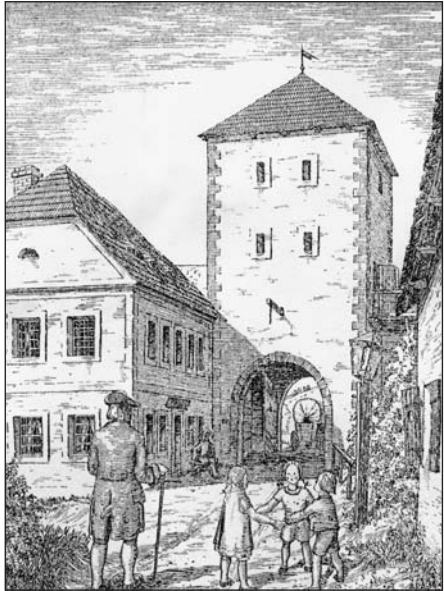
Drážďanská, nebo-li též Horní brána, měla své stanoviště v místech dnešní budovy, ve které se před lety nacházela kavárna Savoy.