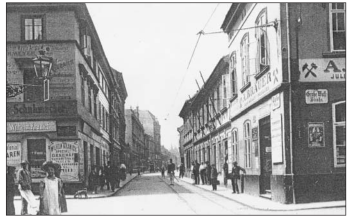
Snímek z roku 1910 zachycuje pohled z dnešního Předmostí do Hrnčířské ulice. Vpravo spatříme roh Velké Hradební. Právě zde stávala Hrnčířská brána s dlouhým tmavým podjezdem a sýpkou nad ním. To vše bylo zbouráno roku 1833 - tedy právě před 170 lety.

napovídá kresba K. Beichlinga z roku 1827, ve vstupu a průčelí vykazovala pozdně gotické tvarosloví obohacené o některé prvky renesanční. Rozhodující vzhled pak stavba doznala až v době pohusitské, jak tomu bylo nepochybně rovněž u ostatních částí opevnění, poničeného bojem v roce 1426. Teplická brána přežila ze všech bran nejdéle. K jejímu zboření došlo roku 1837.