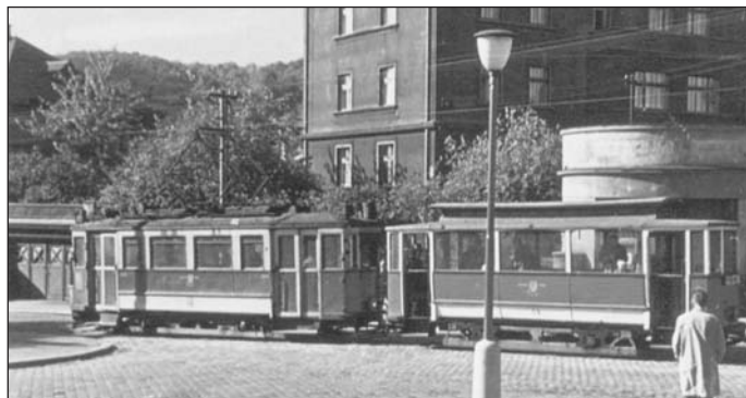
Typická tramvaj s vlečným vozem, jakou bylo možné spatřit v ústeckých ulicích v šedesátých letech 20. století.