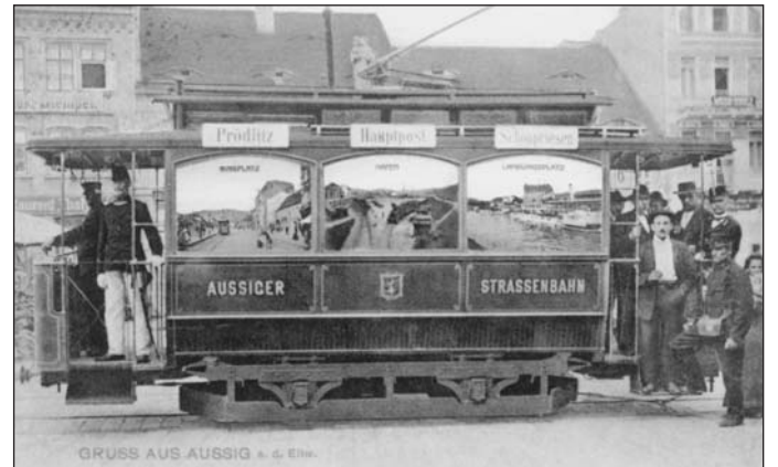
Motorový vůz původní série na výhybně Mírového náměstí. Tyto tramvaje zahajovaly roku 1899 provoz v Ústí nad Labem.