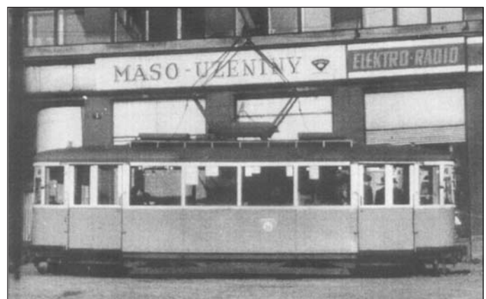
Ústecké tramvaje patřily v poválečném období roku 1947 k hlavním městským dopravním prostředkům. Tehdy obsluhovaly na velké územní rozloze nejen veškeré hlavní tahy dopravy ve městě, ale také okrajové části a obce daleko za Ústím.