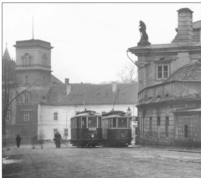
Tratě teplických tramvají byly původně postavené jako jednostopé s příslušnými výhybkami na určitých zastávkách. Na snímku křižování tramvají v dnešní ulici U Zámku před Zahradním a plesovým domem v době po roce 1945.