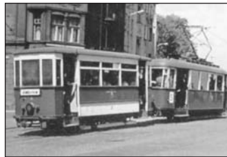
Tramvajové soupravy motorových vozů MT6 s vlečnými vozy patřily v šedesátých letech 20. století v Ústí nad Labem k nejspolehlivějším. Souprava jede vzhůru dnešní Masarykovou ulicí směrem na Bukov a Všebořice.

Rozvoj dopravy a zájem okolních obcí umožnil stavbu dalších tratí i mimo katastr města. S tím souvisela rovněž změna firemního názvu z Ústecké pouliční dráhy na Ústecké malodráhy. Nejprve byl dokončen okruh ve vnitřním městě