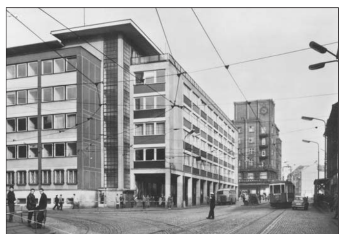
K uzlovým bodům ústeckých tramvají patřila křižovatka s Revoluční a dnešní Masarykovou ulicí pod Městským divadlem.