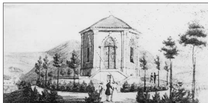
Dobová grafika osmibokého pavilónu na návrší Mont de Ligne nad Šanovem ve třicátých letech 19. století.

da Na vršku nebo Horský zámeček. Její hlavní předností byl krásný výhled dolů na Teplice. Z těchto důvodů ji navštěvovali nejen Teplicané, ale též i lázeňští hosté. Kromě toho zde čepovali výborné pivo, víno a nabízeli nejrůznější speciality za lidové ceny při pozorování obsluhy. Vyhlášená restaurace zanikla teprve až v osmdesátých letech 20. století, na začátku rozsáhlé výstavby Nové Vsi.