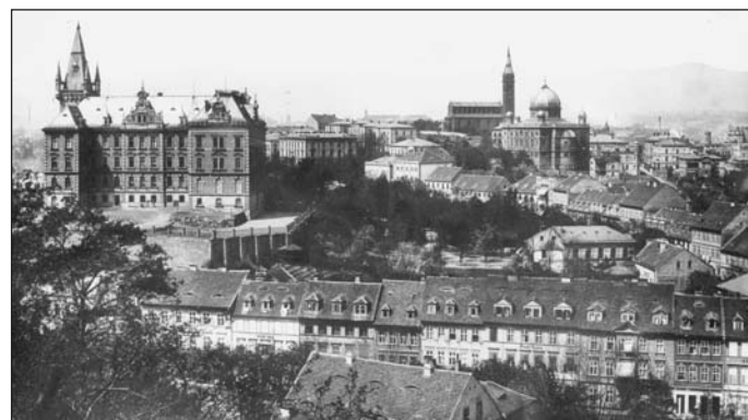
Panorama Teplic z někdejší Štěpánské výšiny, dnes Janáčkových sadů, bylo zachyceno kolem roku 1905.