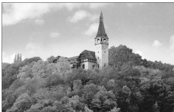
Oblíbené vyhlídkové místo Ústečanů, Větruše, ještě před požárem na konci 20. století, kdy už zde vše chátralo.