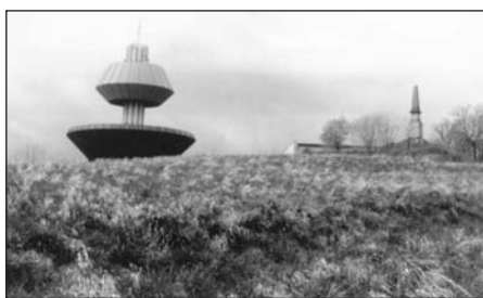
Na vrcholu kopce Ve chvojkách nad Novou Vsí se nacházejí dvě dominanty - vodojem a Kudlichův pomník.