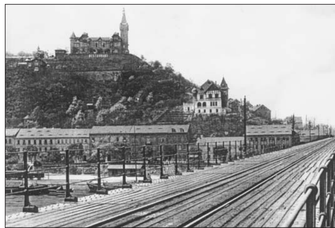
Snímek z doby kolem roku 1900 zachycuje ještě starý železniční most i se Šibeničním vrchem, kde stojí Větruše. Vila pod Větruší i řadová zástavba byla zničena při leteckém náletu v roce 1945.