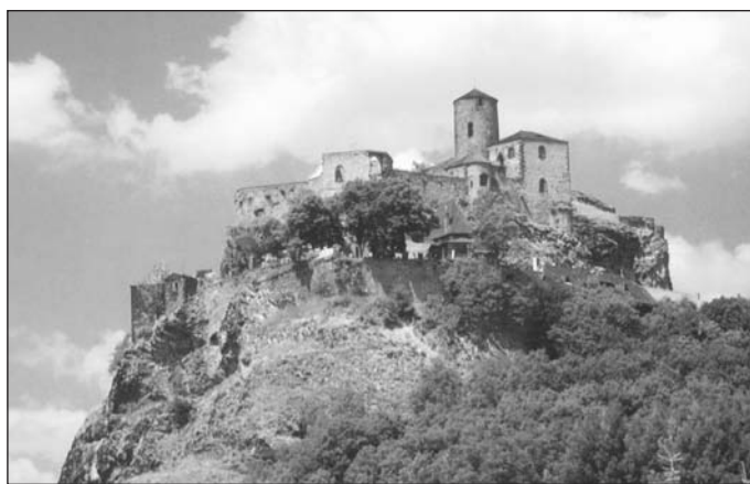
Hrad Střekov patří i dnes k oblíbeným výletním místům a vyhlídkám na 114 m vysokém zhlčovém ostrohu nad řekou Labe.