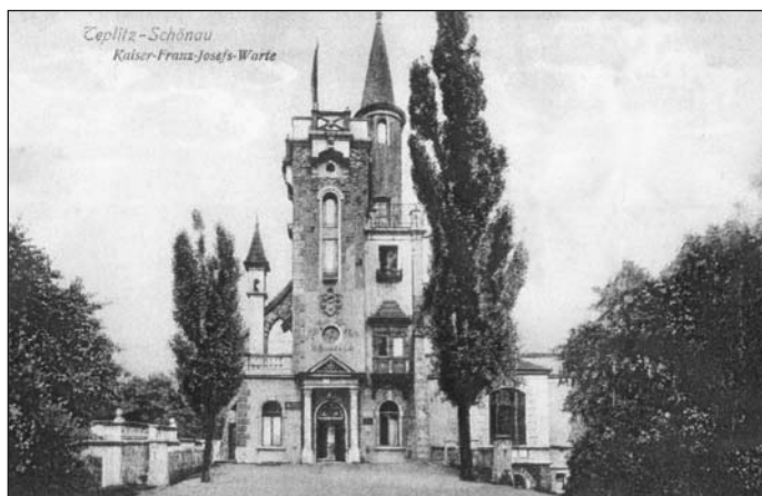
Snímek z období kolem roku 1906 zachycuje ještě v plné kráse někdejší rozhlednu a restauraci na dnešní Letné, která nesla vznešený název Stráž císaře Františka Josefa. Později se jí též říkalo Malý nebo Kozí hrádek.