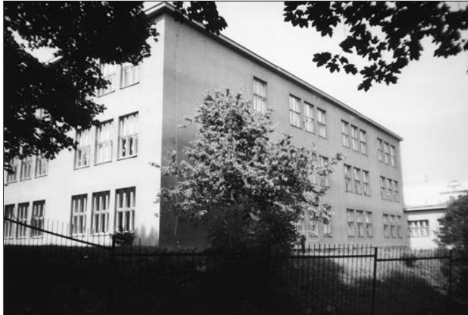
Když už stará školní budova v Solní ulici potřebám české školy nestačila, došlo k výstavbě nové moderní české školy s 19 třídami na Klíši v dnešní Palachově ulici. Poprvé se tady začalo vyučovat před 73 lety v září roku 1930.