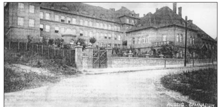
První samostatné české gymnázium v Ústí nad Labem vzniklo roku 1926 v nově postavené budově, která se nachází v ulici České mládeže. Dnes je zde umístěna část Univerzity Jana Evangelisty Purkyně. Snímek je z roku, kdy byla škola nově otevřena.