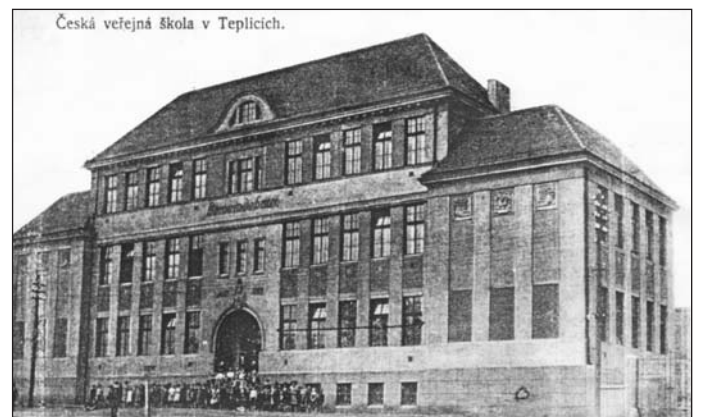
V roce 1912 postavilo město pro českou školu samostatnou budovu v Jateční ulici. Až do konce existence Rakouska-Uherska na ní však nebylo veřejně povoleno označení školy, ale pouze jen „obecní dům“.