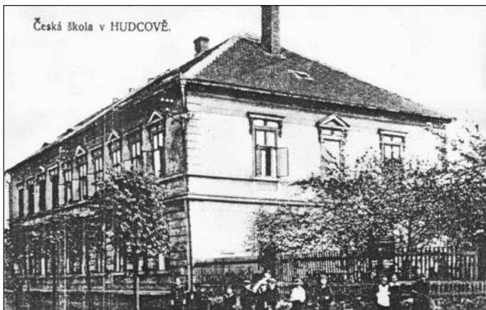
České děti z Hudcova navštěvovaly zpočátku mateřskou školu buď v Teplicích nebo v Košťanech. Vlastní školní budova zde pak sloužila po vzniku Československé republiky od roku 1919. Snímek je z doby kolem roku 1920.

Situace českého školství se na Teplicku zlepšila zejména po vzniku samostatné Československé republiky, kdy české školy získaly buď samostatné budovy nebo došlo pro tyto účely k výstavbě nových školních zařízení. Od dvacátých let tak nastal na Teplicku další rozvoj českého školství, což přineslo s výjimkou let 1938 až 1945, vzdělání již několika generacím. PAVEL KOVÁŘ