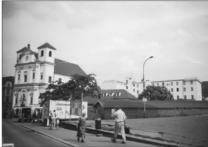
Současný pohled na místo mezi dvěma kostely v centru Ústí n. L., kde dříve stála nejstarší školní budova v Ústí nad Labem. Budova, v níž byla od roku 1919 umístěna též první česká obecná škola, zanikla během náletu koncem druhé světové války. Dnes zde najdete tzv. starou městskou tržnici.