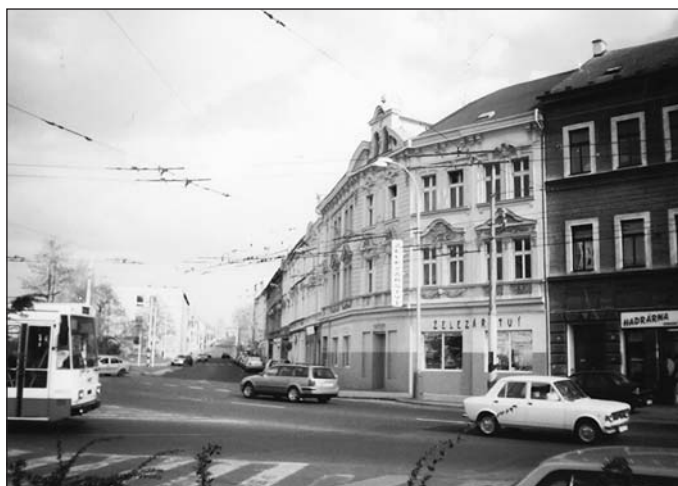
Veřejná česká škola v Trnovanech byla zřízena od roku 1904 a společně s mateřskou školou umístěna v domě rodiny Bárovy na rohu Modlanské a Chlumecké třídy (dnes Masarykovy). Jednalo se o největší českou školu v celém okrese. V přízemní části budovy dnes nalezneme prodejnu železářství.