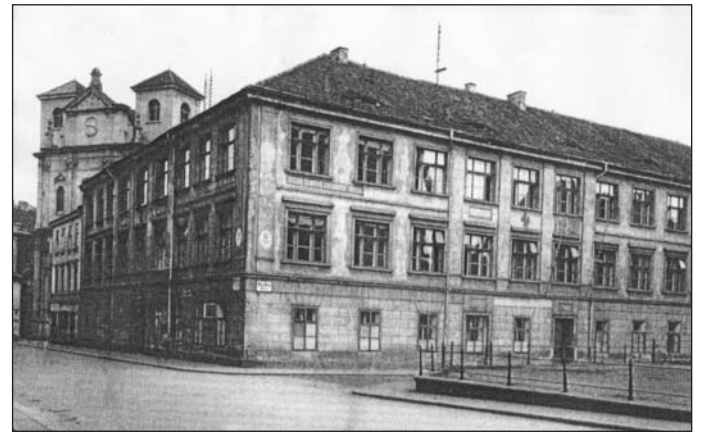
Snímek z roku 1925 zachycuje nejstarší ústeckou školní budovu, postavenou v roce 1852 v někdejší Solní ulici. A právě v ní došlo roku 1919 k otevření první české obecné školy. Budova zanikla při náletu v dubnu 1945. Na jejím místě dnes najdete tzv. starou tržnici mezi kostelem sv. Vojtěcha a kostelem Nanebevzetí Panny Marie.

denti pobíhali mezi německým gymnáziem, průmyslovkou a reálkou. Místnosti přidělené pro potřeby českého gymnázia byly většinou ve špatných suterénních prostorách. Obrat nastal až v roce 1924, kdy město začalo s výstavbou nové budovy, kterou navrhl klasik české moderní architektury profesor Josef Gočár. A tak bylo české gymnázium, postavené nákladem 4,5 milionu korun v ulici České mládeže slavnostně otevřeno 5. září roku 1926. Tato budova dnes slouží Univerzitě Jana Evangelisty Purkyně v Ústí nad Labem. PAVEL KOVÁŘ