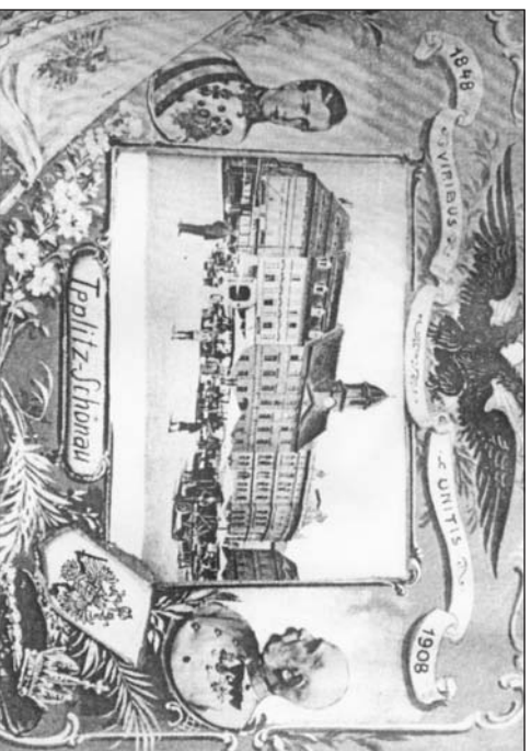
Jubilejní pohlednice z roku 1908, vydaná u příležitosti 60. výročí vlády rakouského císaře, zachycuje někdejší Tržní, dnes náměstí Svobody i další dokreslené emblemy císařského Veličenstva. Vlevo podobizna ještě mladého osmnáctiletého vládkáře z roku 1848, vpravo pak tenký, ovšem už staříky moonář z roku 1908.