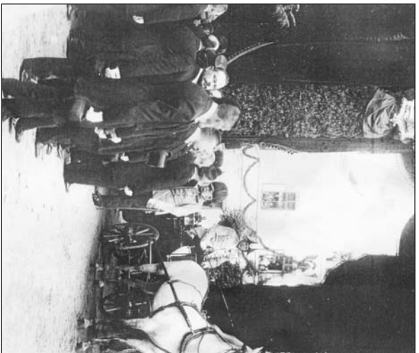
Při své návštěvě Ústí nad Labem zavítal vládář 17. června 1901 též do Spolku pro chemickou a hutní výrobu (na snímku uprostřed, když vystoupil z kočáru).