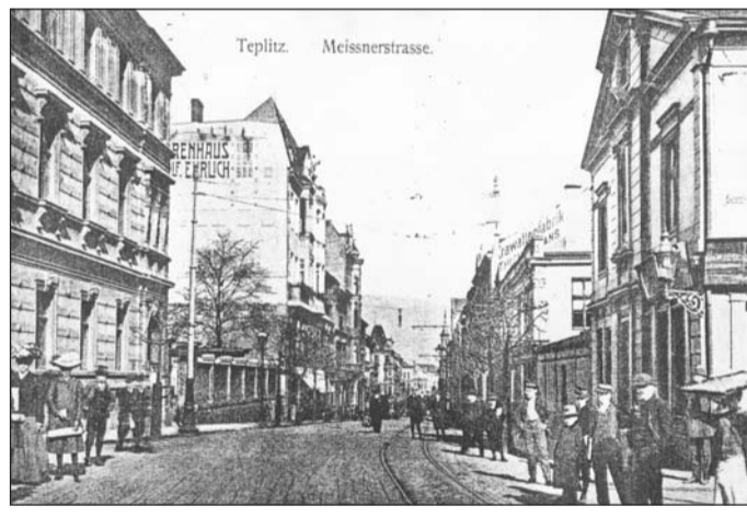
Pohled do někdejší Meissnerovy ulice směrem od dnešního Benešova náměstí v roce 1911. Některé domy vydržely s určitými změnami až do současnosti, jiné se zcela změnilo. Někde spatříme ještě i nezastavěné volné parcely mezi domy.