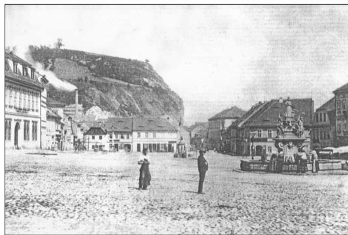
Jeden z nejstarších dochovaných ústeckých snímků zachycuje někdejší Tržní, dnes Mírové náměstí v době kolem roku 1870. Jedná se o pohled směrem k Mariánské skále, kterou spatříme v pozadí. Vpravo je pak ještě zachycena stará renesanční kašna, odstraněná v osmdesátých až devadesátých letech 19. století.