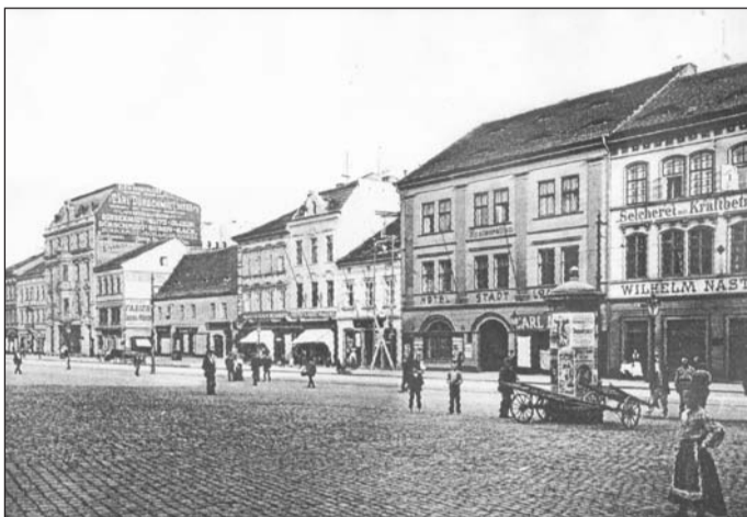
Pohled na zástavbu jižní strany tržního náměstí v roce 1899. Linie domů se sice dodnes nezměnila, ovšem dnešní zástavba prošla už mnoha změnami - zvýšením pater i celkovou modernizací.

Někdejší stará osada Ústí byla založena v dávných dobách v místech, kde ústí řeka Blžina, též zvaná dříve Bělá, do Labe. Odtud také dostala obec svoje jméno. Výhodnost obrany tohoto místa zůstává i dnes na první pohled zřejmá. Na jihu uzavírá údolí vrch Větruše, na severu strmá Mariánská skála, na východě vrch Sedlo a na jihovýchodě Střekovská skála. Do této sevřené kotliny vedlo hned několik starobylých obchodních cest, spojujících Čechy se sousedními zeměmi.