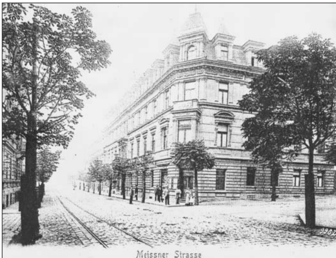
Pohled do tehdejší Meissnerovy ulice směrem do hlavního nádraží, jak to zde vyhlíželo před sto lety počátkem 20. století. V této části patřily domy k opravdu vzhledným a výstavným. Ulicí lemovalo z obou stran osvěžující stromořadí a v levé části vozovky vedla úzkorozchodná tramvajová trať.