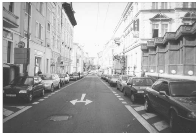
Současný pohled do bývalé Meissnerovy ulice a dnešní jednosměrné ulice 28. října ve směru od hlavního nádraží. Dávno již zmizelo stromořadí i nejstarší úsek tramvajové tratě.