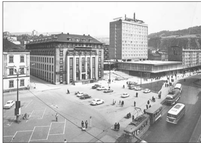
Ústecké Mírové náměstí z konce šedesátých let 20. století. Tehdy již zmizela část staré zástavby směrem do Hrnčířské ulice a její místo zaujal Interhotel Bohemia i s komplexem nové výstavby. Tramvaje tudy projížděly až do roku 1970.