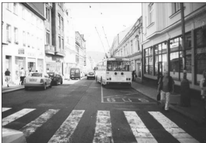
Dnešní pohled do ulice 28. října směrem od Benešova náměstí. Na první pohled je zřejmé, že se tu již mnoho změnilo. Trolejbusy, které nahradily původní tramvaje, tudy projíždějí již 45 let.

Dřívější Meissnerova ulice představovala elegantní třídu plnou obchodů s vybraným zbožím, množ-