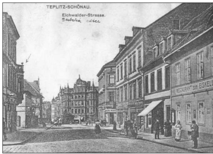
Tudy se v dobách středověku projíždělo cestou z města od Lesní brány přes pole zvané Literátská dědina směrem na Dubí. Po odstranění městských hradeb pak vznikala zástavba i v těchto místech. Na snímku z roku 1914 spatříme ještě zástavbu Dubské ulice po obou stranách. V popředí vpravo restaurace Lednice - dnešní Slávie a uprostřed v pozadí dominuje někdejší nepřehlédnutelný Muzikantský dvůr.