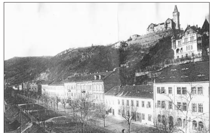
Snímek pořízený kolem roku 1900 zachycuje Labskou dnes pražskou ulici pod Soudním vrchem s Větruší. Právě v této ulici, v domě čp. 44, zemřel v březnu 1877 známý ústecký malíř E. G. Doerell.