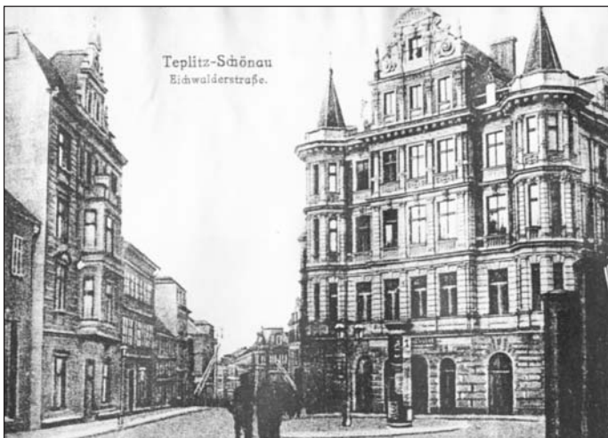
Na snímku z roku 1910 spatříme Muzikantský dvůr ještě v plné kráse, před nímž vzniklo jakési malé náměstíčko. V domech nalevo se nacházely dílny, autodílny i tiskárna. V jednom pak působí dodnes autoškola.