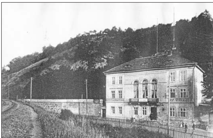
Pohled na spolkový hostinec „Střelecký dům“ na přelomu 19. a 20. století, který se nacházel v dnešní Žižkově ulici na úpatí stráni. Ani ten nebyl ušetřen náletů v dubnu 1945. Vlevo spatříme část železniční tratě.