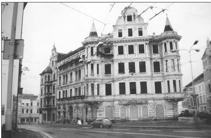
Současný vzhled někdejšího Muzikantského dvora, kterému se dnes říká „Lověna“, neboť tato prodejna byla dříve umístěna v dolní zadržené části domu. Chátrající budova nyní ohrožuje své okolí.

Ještě v dobách, kdy Teplice obepínaly středověké hradby, stávala v prostorách mezi dnešní restaurací Slávie a poštovním úřadem, jedna ze čtyř městských bran zvaná Lesní. Právě tou se vyjíždělo z centra města severním směrem po nejprve klesající cestě na Dubí. Nedaleko za hradbami se tehdy rozkládalo jen pole zvané Literátská dědina. Výnosy z něho šly totiž ve prospěch literátského a zpěváckého bratrstva, které v Teplicích působilo už od 16. století až do doby císaře Josefa II. na konci 18. století.