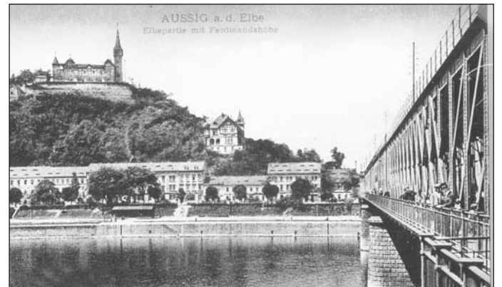
Pohled od starého železničního mostu přes Labe směrem k Soudnímu vrchu s Větruší, pod nímž je vidět dřívější zástavba, pochází z přelomu 19. a 20. století. Přehlédnout nelze dominantní vzornou vilu ve stráni.