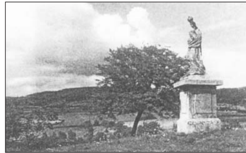
Barokní socha Panny Marie, umístěná původně na zdi vinohradu u Hrnčířské brány, byla v roce 1833 přenesena na Mariánskou skálu.