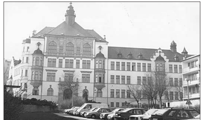
Současný pohled ze Zelené ulice na gymnázium, jehož budova si připomíná sto let své existence. Dominanta celého okolí zřejmě přečká ještě i další dlouhé věky.