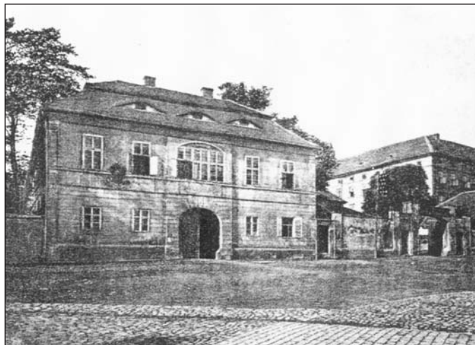
Mořicův dvůr v roce 1902, v posledním období před zbouráním, když si připomínal 101 let své existence.

devatenácté století. K jeho zboření pak došlo až po roce 1902. Na jeho místě se posléze započalo se stavbou mnohem větší a dominantnější budovy - někdejší státní reálné školy, která měla předtím sídlo na Školním, dnes Benešově náměstí. V nové budově, kterou ve stylu německé secese nechal postavit architekt W. Bürger ze Saské Kamenice, se začalo poprvé vyučovat před sto lety, v září 1904. Třebaže samotné průčelí školy působilo poněkud přísným dojmem, interiéry stavby se mohly na svou dobu chlubit dobře vybavenými učebnami a kabinety. Přestože se během celého století vystřídalo v budově kromě středoškolské výuky i mnoho jiných institucí, našlo v ní už před dlouhou řadou let opět