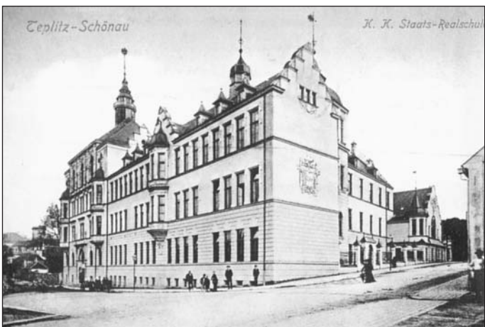
Snímek z roku 1906 zachycuje směrem z Alejní ulice pohled na budovu tehdejší Státní reálné školy, dnes sídla teplického gymnázia.