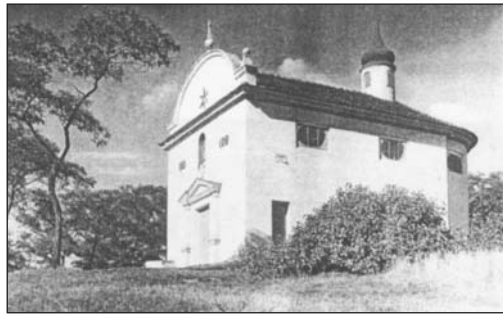
Kaple na Mariánské skále byla postavena roku 1680 jako dík za odvrácení moru. Tento snímek vznikl kolem roku 1930.