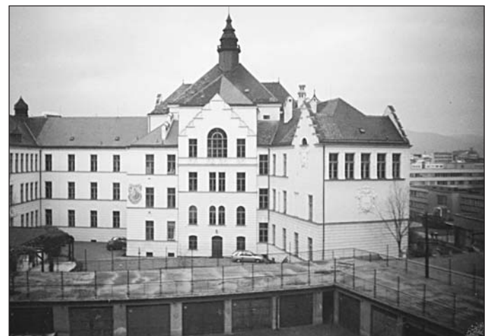
Současný méně typický pohled na budovu teplického gymnázia od jihu z bloku domů v ulici U Zámku.